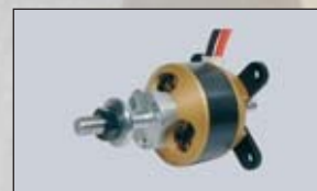
SADA PRO OBRÁCENOU MONTÁŽ RADIAL MOUNT SET BATI MOTEUR RADIAL CASTELLO RADIALE